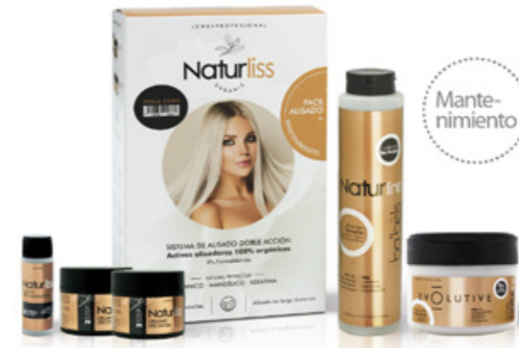
Cuticle Open Shampoo 35ml Orgánico Liss System 120ml x 2