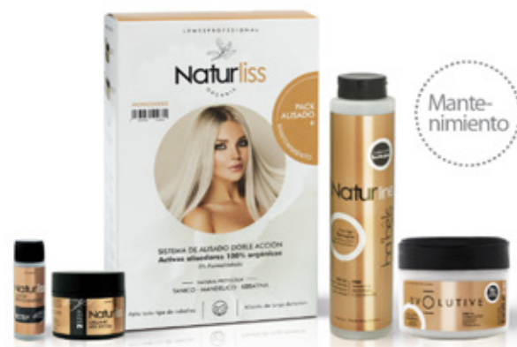
Cuticle Open Shampoo 35ml Orgánico Liss System 120ml