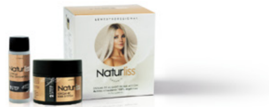
Cuticle Open Shampoo 35ml Orgánico Liss System 120ml