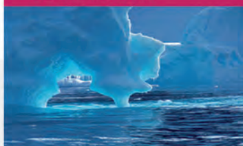
L6 ANTARTIDA (ANTARTIDA)