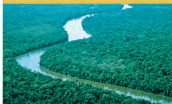
L4 AMAZONAS (BRASIL)