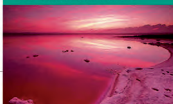
L5 SIVASH (RUSIA)