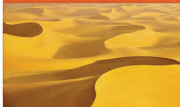
L3 SAHARA (AFRICA)