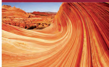
L2 ARIZONA (EEUU)