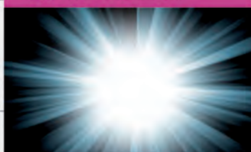
L9 LUZ (CREA TONOS PASTELES)