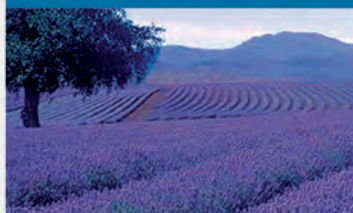
L7 PROVENZA (FRANCIA)