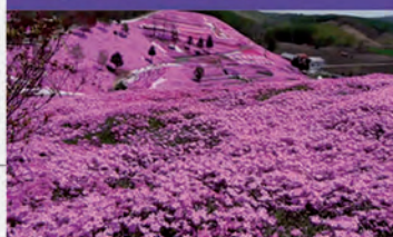
L8 TAKINOUE (JAPÓN)