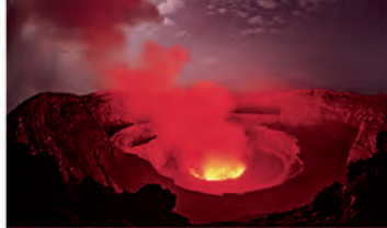
L1 KILAWEA (HAWAII)